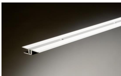
Moldura en T: De laminado a laminado